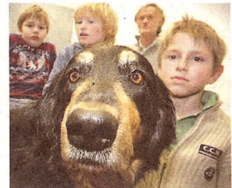
Den Hovawart schlossen die Schüler schnell ins Herz.